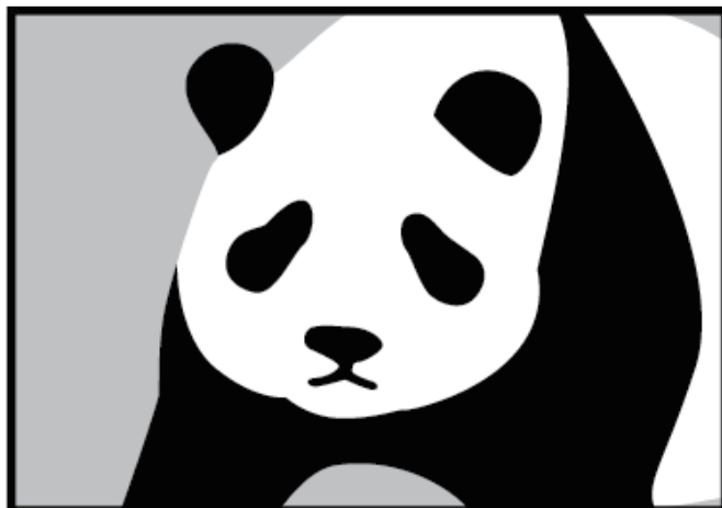
②PRしたい部分を拡大で写す