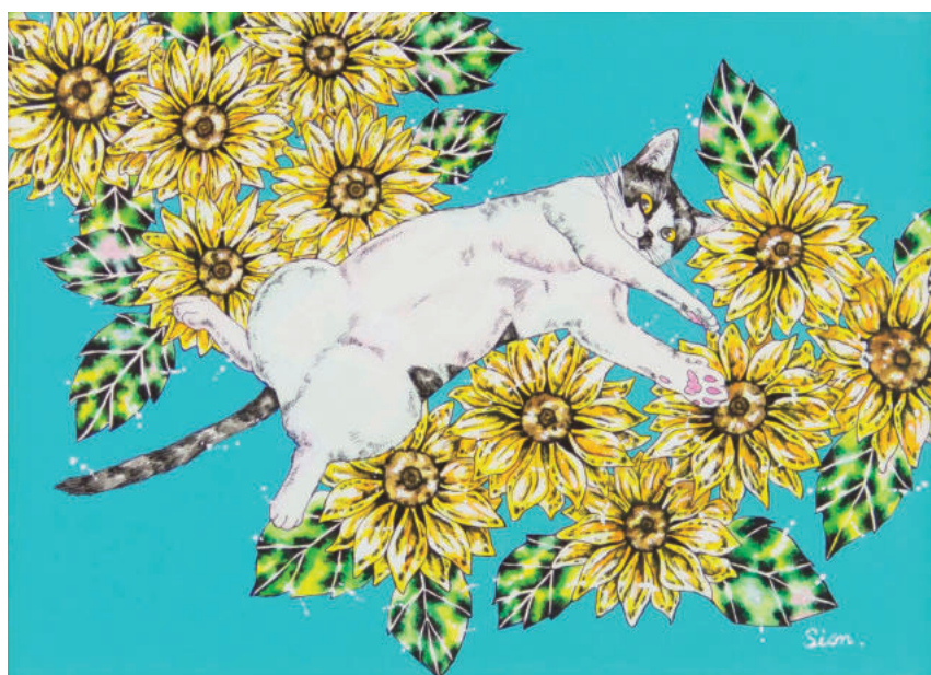
第6回 アキーラコンテスト 最優秀賞「太陽の子」 Sion