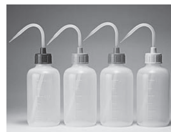
カラーキャップポリビン