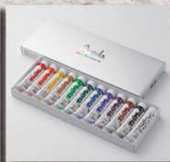
6号 ● 12色セット