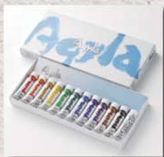
4号 ● 12色セット

アルミチューブで使われているアルミニウムは、リサイクルできます。やわらかいラミネートチューブは、金属がプラスチックにはさまれていて分別できないのでリサイクルできません。