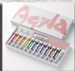
4号 ● 13本セット