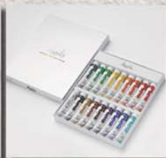
6号 ● 18色セット